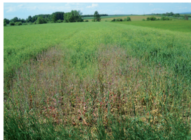
Schaden an Raps durch Sulfonylharnstoffe im Spritzgerät