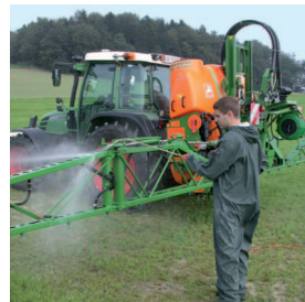
Optimale Außenreinigung am Feld

Experte: Optimal ist die Außenreinigung auf dem Feld mit einer entsprechenden Vorrichtung (Spritzlanze) durchzuführen. Gerade wenn die Spritzbeläge noch feucht sind, ist auch mit wenig Wasser ein guter Reinigungseffekt zu erzielen. Ist kein Außenreinigungsset vorhanden, kann dieses mit relativ geringem Aufwand nachgerüstet werden.