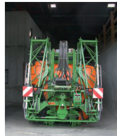
Abstellen unter Dach

Experte: Das Pflanzenschutzgerät sollte unter Dach abgestellt werden, damit etwaige Reste von Präparaten an der Außenseite des Gerätes nicht durch Regen abgewaschen werden und so z.B. direkt über die Kanalisation in Oberflächengewässer gelangen können.