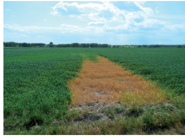
Schaden an Getreide durch schlechte Spritzenreinigung

Experte: Eine Reinigung der Spritze verhindert Störungen wie z.B. verstopfte Düsen, Ablagerungen (an Filtern und im flüssigkeitsführenden System) und erhöht die Einsatzsicherheit bzw. die Lebensdauer des Gerätes. Beim Wechsel auf eine andere Kultur verhindert eine sorgfältige Reinigung zudem die Verschleppung von Pflanzenschutzmitteln auf nicht zugelassene Kulturen (Rückstände) und beugt Spritzschäden an empfindlichen Kulturen vor.