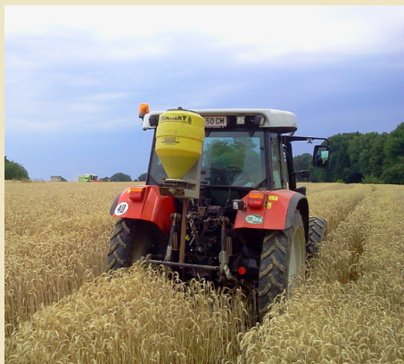
Optimaler Erosionsschutz bei Einsaat von Zwischenfrüchten.

Falls gepflügt wird, hat sich ein Untergrundlockerer am Pflugschar zum Aufreißen der Pflugsohle bewährt. Je tiefer die Bearbeitung, desto trockener muss der Boden sein. Bei einer tiefen Lockerung ist eine sofortige Begrünungsaussaat mit tiefwurzelnden Pflanzen (zB Ackerbohne, Ölrettich, Sareptasenf, Luzerne) erforderlich, um die Verfrachtung von Feinmaterial in die gelockerte Schicht durch eine entsprechende Lebendverbauung der Hohlräume zu vermeiden. In Hanglagen ist aufgrund der Erosionsgefahr jedenfalls ein grobes Saatbett anzustreben.