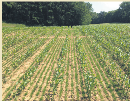
Untersaat bei Mais mit Aerosem. Pöttinger

Pöttinger gelang mit der Neuentwicklung der pneumatischen Sämaschine Aerosem ein einzigartiger Streich: die Integration von Einzelkornsätechnik in eine pneumatische Standard-Sämaschine. Die Vorteile beider Welten wurden in einer Maschine vereint, die besonders für den Einsatz in Maisausaat hervorragend geeignet ist. Die Maschine verfügt über bis zu zehn Einzelkornenelemente für 37,5 beziehungs-