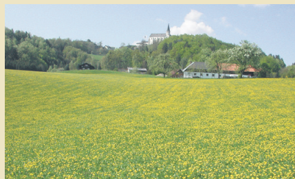
In der SGD 7 ist eine Einstufung der Humusgehalte enthalten. BWSB/Hözl

Für die Durchführung der Beprobung werden nähere Details bezüglich Verteilung der 25 Einzelproben (Einstiche) und unterschiedliche Bodenprobenahmegeräte (Schüsslerbohrer, Schlagbohrer, Bodenstecher) angegeben. Zum Thema „Humusgehalt“ werden Begriffe wie „Nährhumus“ und „Dauerhumus“ sowie „Humifizierung“ und „Mineralisierung“ erklärt. Weiters wurde auch die Einstufung der Humusgehalte für Grünland erweitert. Darüber hinaus ist für die Charakterisierung der Stabilität der organischen Substanz das C/N-Verhältnis inklusive Beispielen und Bandbreiten dargestellt.