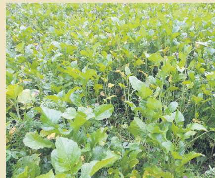
Sareptasenf (Sorte: Vitasso) in einer Mischung mit Phacelia und Ölrettich. Im Herbst gut entwickelt, keine Blüte. BWSB