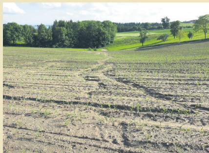
Die langsame Jugendentwicklung des Maises birgt die Gefahr der Bodenerosion.

Speziell im Hang verschärft sich die Problematik noch deutlich. Gesellschaftspolitisch führen diese oberflächlichen Verschlämmungen und der Erdabtrag zu unnötigen Kosten: sei es mit Erde verschlammte Hausgärten oder Pools einerseits oder Wertverlust der Ackerböden durch den Humusabtrag.