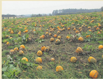
Ölkürbis zählt aufgrund der nunmehrigen Flächenrelevanz wieder zu den Ackerkulturen.

Silo-Hirse/-Sorghum und Körner-Hirse/-Sorghum werden aufgrund der unterschiedlichen Erträge der daraus resultierenden unterschiedlichen Düngebedarfe getrennt.