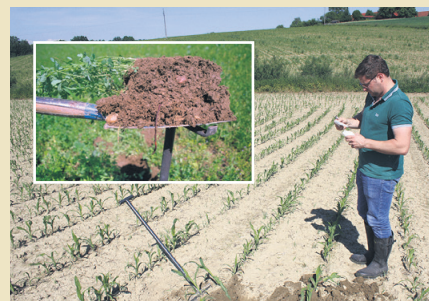
Eine Spatenprobe gibt Aufschluss über den Bodenzustand.

Ist die nächste Hauptfrucht Mais oder Zuckerrübe, welche Böden ohne Verdichtungen und Horizonte bevorzugen, oder wird mehrjähriges Feldfutter angebaut, das den Boden schön langsam selbst durchwurzelt und aufschließen kann? Davon wird es abhängen, wie tief und intensiv der Boden bearbeitet werden soll. Die einfache Frage, ob Pflug oder Grub-