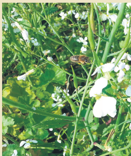
Früh blühende Zwischenfrüchte wie Ölrettich (Sorte: Arena) werden im Spätsommer von Bienen gerne angefliegen. BWSB

Die Zwischenfruchtkulturen sollten anderen Pflanzenfamilien angehören, um den Krankheitsdruck für die Hauptkulturen – im Sinne des integrierten Pflanzenschutzes – nicht unnötig hoch zu halten. Dieses Prinzip sollte bei Kreuzblütlern (zB Raps – Senf, Ölrettich), aber auch bei Gräsern (Getreide) und Leguminosen eingehalten werden. Sind in Mischungen unterschiedliche Pflanzenarten und -familien enthalten, werden die Krank-