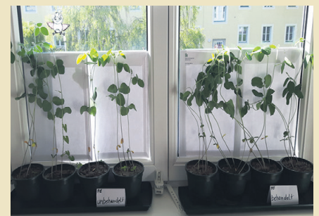
Für den Versuch die Sojablanke sechs Wochen wachsen lassen.

Vor dem Anbau wird eine repräsentative Bodenprobe vom Acker gezogen, eine Hälfte (Kontrolle) bleibt unbehandelt, die andere wird im Backrohr bei einer Temperatur zwischen 70 bis 100 Grad Celsius wärmebehandelt. Anschließend werden je vier Blumentöpfe mit unbehandelter und mit behandelter Erde befüllt. In jeden Topf werden fünf Sojasamen gesät. (Es können auch andere Körnerlegumi-