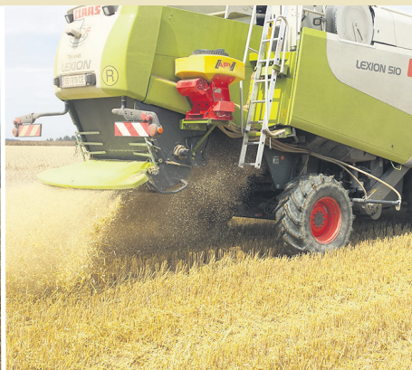
BWSB, LK OÖ

Die meisten Zwischenfruchtarten sind für eine optimale Entwicklung auf einen frühzeitigen Anbau (Mitte Juli bis Anfang August) angewiesen. Ab der zweiten Au-