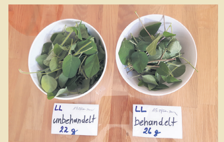
Die Blattmasse wird abgewogen und beide Varianten werden verglichen.