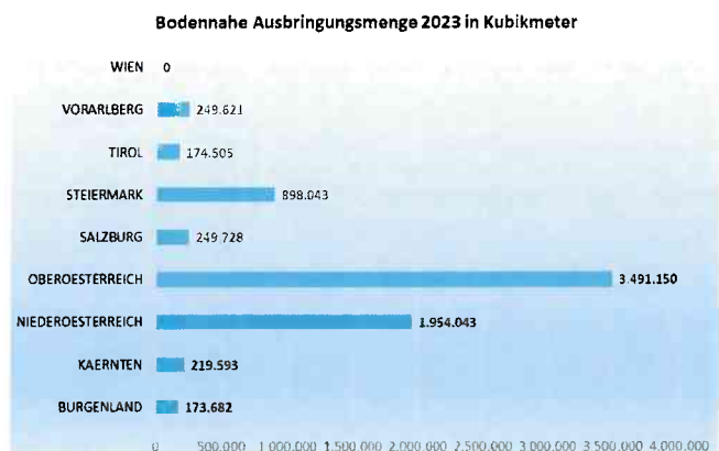
Bodennahe Ausbringungsmenge 2023 im Bundesländervergleich.