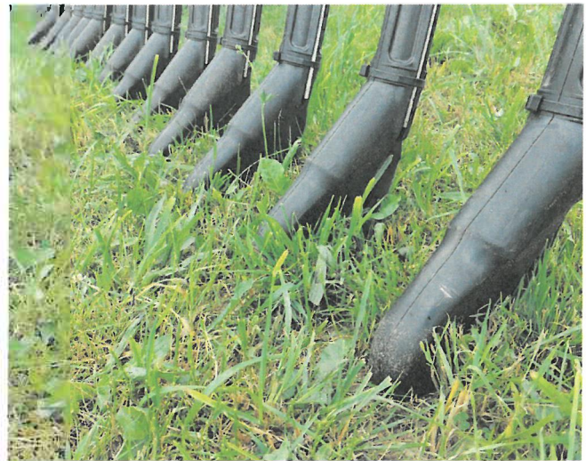
Bodennahe Gülleausbringung reduziert Ammoniak-Emissionen.

www.lko.at bzw. auf der AMA-Homepage unter www.ama.at sind die Maßnahmen-erläuterungsblätter veröffentlicht.