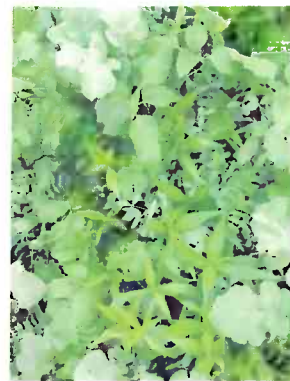
Eine Zwischenfruchtmischung sollte stets aus unterschiedlichen Pflanzen(familien) bestehen. BWSB

Achtung: Die jeweils strengere Vorgabe ist einzuhalten – vor allem bei der Unterscheidung der Stickstoffbegren-