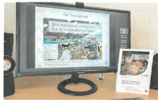
Online informierten sich über 230 Teilnehmerinnen und Teilnehmer am Landestag der Milchviehhaltung.

Am 27. November wurde zu Themen wie Agrarpolitik, Burnout am Milchviehbetrieb, Fütterung in der Transitphase und „Was wir von erfolgreichen Bäuerinnen und Bauern lernen können“ referiert und diskutiert.