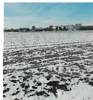
Auch nach Sperrfristende darf Gülle nicht auf gefrorenem Boden ausgebracht werden.

Nach dem Ende des Verbotzeitraumes dürfen leichtlösliche stickstoffhaltige Düngemittel in einer Höhe von maximal 60 Kilogramm Stickstoff ab Lager auf Böden ausgebracht werden, die durch Auftauen am Tag des Auf-