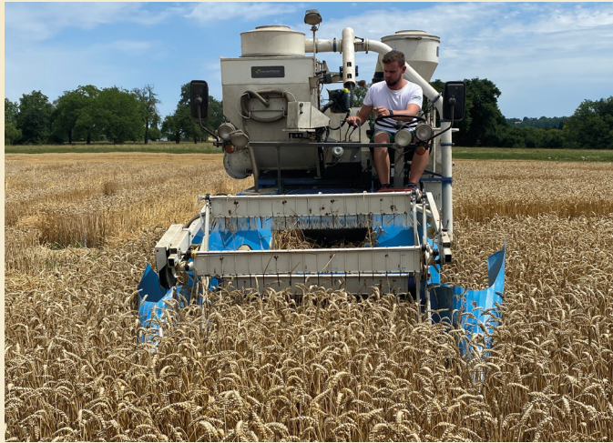
Kerndrusch mittels Parzellenmähdröschler.