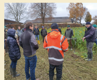
Bild 4: Einen wichtigen Beitrag zum Boden- und Gewässerschutz leisten die Feldbegehungen zum Thema Bodenkunde, Düngung und Zwischenfruchtanbau.