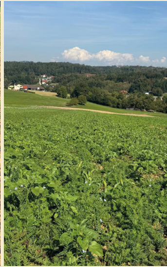
Bild 2: Bestand in Katsdorf am 29.09.2024