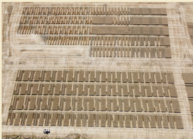
Versuchsfläche von oben – der Aufwand ist enorm.