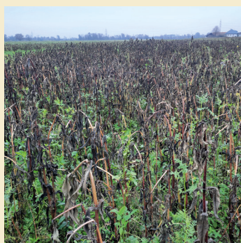
Bild 10: Temperaturen im Bereich des Nullpunktes zeigen sofort Auswirkungen auf das Ramtillkraut/7er Mischung (Burgkirchen, 12. 11. 2024).