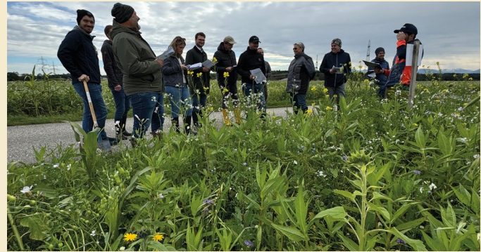
Bild 12: Versuchsrundfahrt organisiert von der Boden.Wasser.Schutz.Beratung mit Beraterinnen und Beratern von Saatgutfirmen, Land Oberösterreich und LK OÖ (Sipbachzell), 30.09.2024.

Bei den Leguminosen (Kleesorten, Wicken, ...) ist die Stickstoffgewinnung voll angelaufen und die Knöllchen an den Wurzeln sind gut entwickelt. Bei der großen Familie der Kreuzblütler (Senf, Rettich, ...) erkennt man jedes Gramm Nährstoffe im Boden – vor allem auf Wirtschaftsdüngerstandorten war noch ein richtiger Wachstumsschub erkennbar. Diese Nährstoffe sind jetzt in den Pflanzen als Depot für die nächste Kultur bis zum Frühjahr eingelagert. Auch in die Wurzelentwicklung wird von den Pflanzen noch viel investiert – Phacelia, Sonnenblume, Öllein unterstützen mit ihrem feinen Wurzelsystem die „Durchschlagskraft“ der Pfahlwurzeln