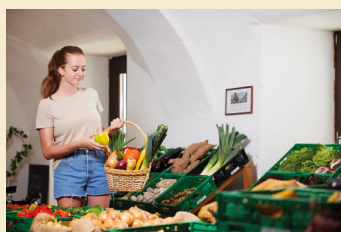
Bild 1: Regionalität, Frische und eine gute Ökobilanz ist den Konsumentinnen und Konsumenten zunehmend wichtig.

Der Gemüsebauarbeitskreis der Boden.Wasser.Schutz.Beratung unterstützt die Gemüsebetriebe in der Theorie und Praxis. Nicht nur Arbeitskreistreffen, sondern auch Feldbegehungen sollen den Landwirtinnen und Landwirten dabei helfen, gesetzliche Auflagen in der praktischen Bewirtschaftung umzusetzen. Der heimische Gemüsebau muss gefördert werden, darf aber gleichzeitig nicht den Grundwasserschutz ausschließen.