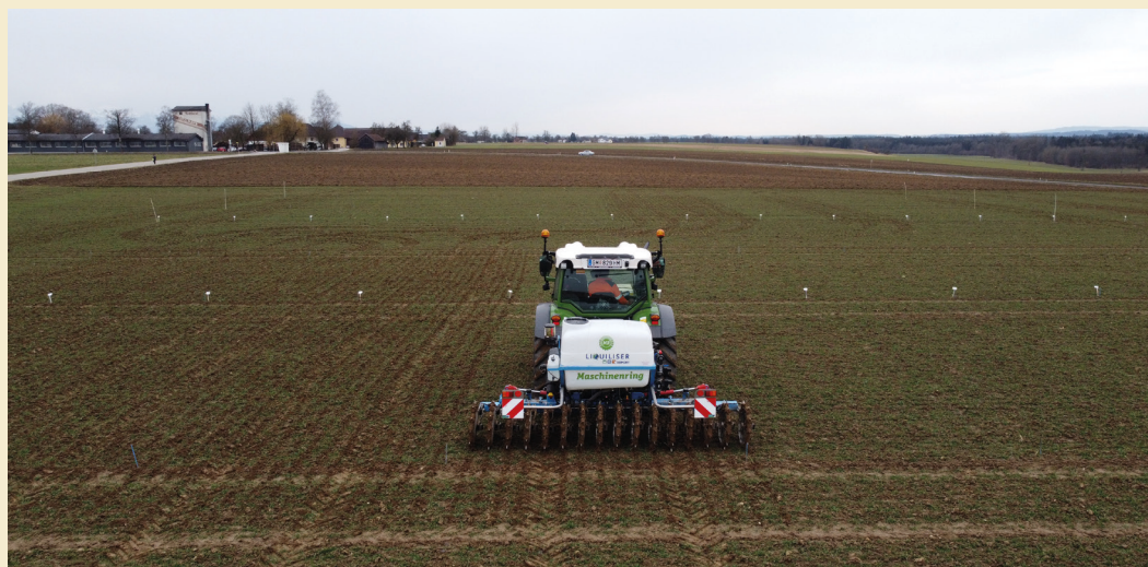
Anlage des vierfach wiederholten Cultandüngungsversuches.

Neben den Cultanvarianten wurden als Vergleich auch Düngevarianten mit granulierten Mineraldüngern angelegt. Die Aussaat des Weizens (Sorte Tiberius) erfolgte am 8. Oktober 2023. Die Cultananwendung wurde am 5. April 2024 in EC 30/31 bei feuchten Bodenbedingungen durchgeführt; die Vergleichsdüngevarianten wurden zu den Terminen händisch gestreut.