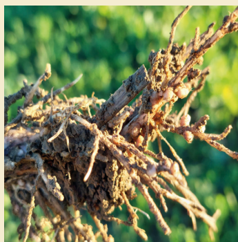
Bild 8: Knöllchenbakterien an Leguminosen (St. Florian, 06.10.2024).