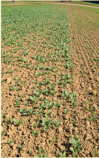
Bild 1: Bestand in Katsdorf am 29.08.2024 BWSB