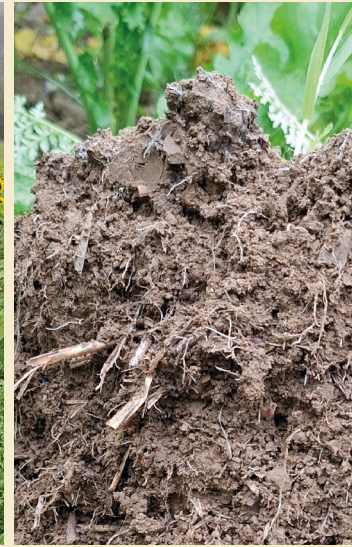
Bild 4: Gute Bodenstruktur durch Wurzeln und Bodenorganismen BWSB