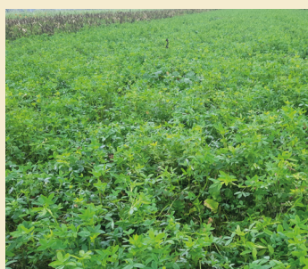
Bild 9: Variante winterhart + abfrostend – gute Wasserverhältnisse sind für das Gedeihen von Leguminosen (Alexandrinerklee) ausschlaggebend – siehe Vergleich Bild 6 (Burgkirchen, 12. 11. 2024).