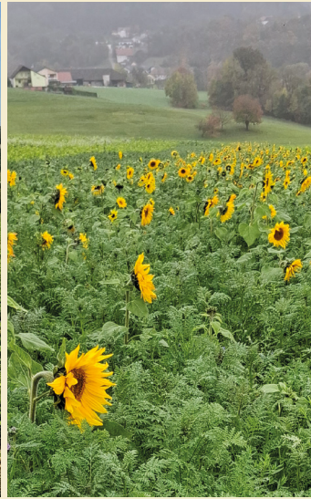
Bild 3: Bestand in Katsdorf am 31.10.2024 BWSB