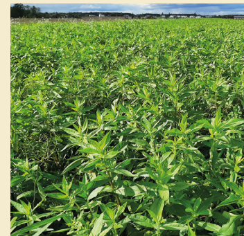
Bild 7: 7er Mischung (11.10.2024, Sipbachzell).