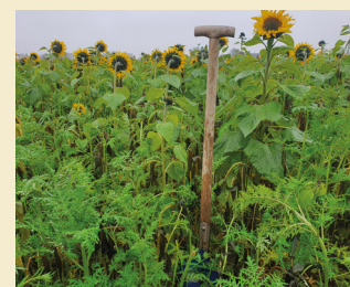
Bild 2: Im Spätherbst bereichern Zwischenfrüchte das Landschaftsbild – ein Gewinn für die öffentliche Wahrnehmung.

Am Ende des Tages zeigt sich, dass die Bodenkunde und die Bodenfruchtbarkeit über den Erfolg eines jeden Betriebes entscheiden.