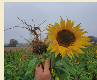
Bild 3: Zwischenfrüchte helfen, Nährstoffe wie Nitrat und Ammonium zu binden und reduzieren so das Risiko der Auswaschung ins Grundwasser.