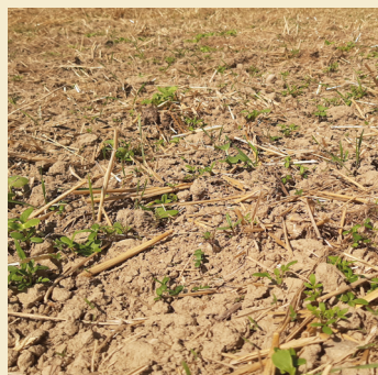
Bild 5: Vor allem die Kreuzblütler konnten trotz Trockenheit keimen (07.08.2024, Sipbachzell).

da hier nachweislich die unproduktive Verdunstung (=Evaporation) des im Boden gebundenen Wassers steigt. Wichtig bei diesen Bearbeitungssystemen ist eine entsprechende Rückverfestigung – beispielsweise mittels Packer. Das heurige Jahr verdeutlichte einmal mehr, wie sehr man im Pflanzenbau auf die Unterstützung von Mutter Natur angewiesen ist.