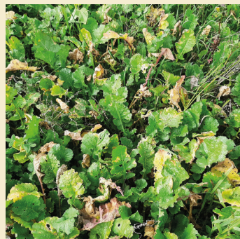
Bild 6: Variante winterhart + abfrostend (11.10.2024, Sipbachzell).