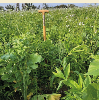
Bild 11: Mitte September spatenhohe Zwischenfrüchte – qualitativ und quantitativ hochwertiges Futter für das Bodenleben (Otterbach, 23. 09.2024).